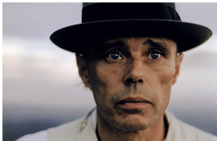
Portrett av Beuys

Alt dette viser at Steiners impuls hadde en sterk etisk, sosial side. Steiner trodde på kunstens revolusjonære potensial, men kunsten skal ikke være agitator, man skal ikke male en lære. For Steiner var kunstnerisk virksomhet selve drivkraften i samfunnsutviklingen. Han håpet at all menneskelig virksomhet skulle bli til kunst. Derfor la han til den sosiale kunsten som en ny kunststart, som den høyeste og kanskje også den vanskeligste? Inspirert av Steiner utviklet Josef Beuys sine tanker om den