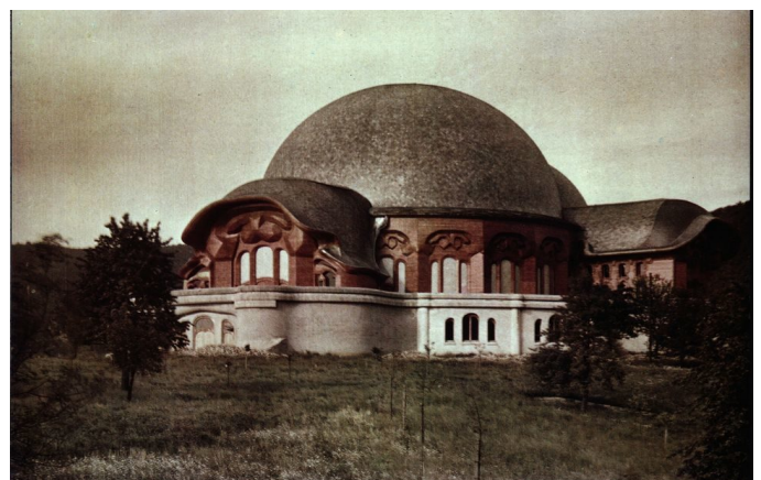
Andre og første Goetheanum