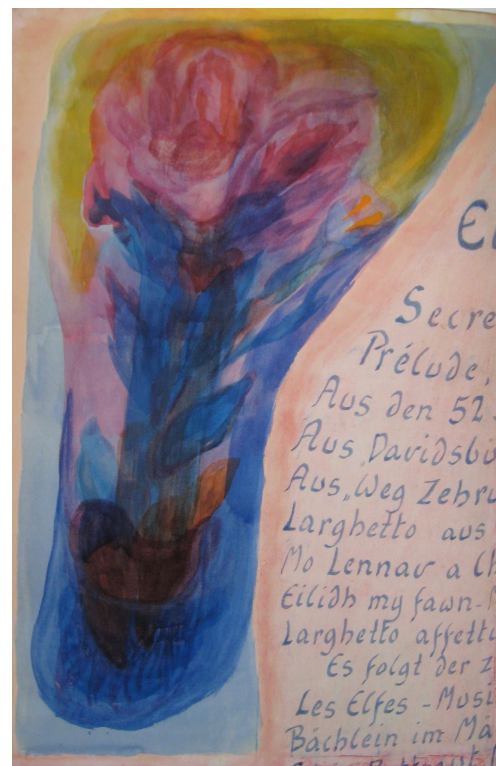
Urplante, akvarell, 1924

Her kommer også betrakteren inn som den som skaper videre og bidrar til at verket får et liv i framtiden. Steiner interesserte seg for kunstverkets konseptuelle side da han uttrykte at et kunstverk ikke er ferdig før det blir skapt på nytt i betrakterens indre. Han kunne forutse utviklingen av en konseptuell kunst og betraktet denne som et steg i kunstens egen prosess i det å forstå hva kunst er. En situasjon der kunsten filosoferer over seg selv og kunstverkene så og si snakker med hverandre. Steiner hevdet videre at denne utviklingen ville lede fram til en imaginativ opplevelse av kunsten. I hele forrige århundre har vi sett hvordan de ulike ismene, kunstretningene, står i en dialog med hverandre, avløser hverandre, og hvordan filosofien har tatt steget inn i kunsten på en markant måte. En prosess der nettopp konseptkunsten visualiserer og stiller spørsmål til betrakteren som handler om hvordan vi opplever og ser, synliggjør dype, kompliserte kunnskapsteoretiske forhold.